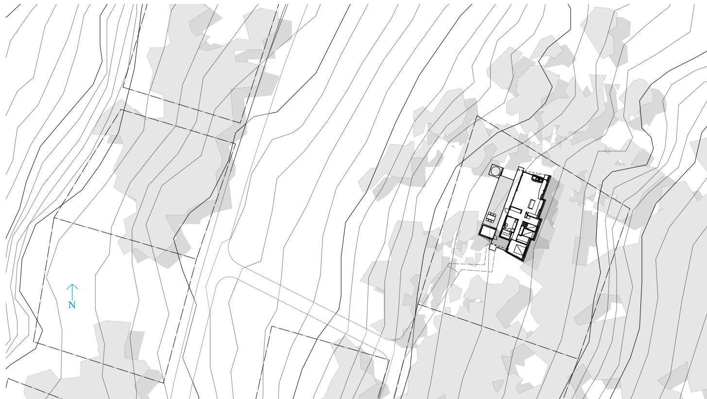
Situasjonsplan. Målestokk 1: 800. Site plan. Scale 1: 800.