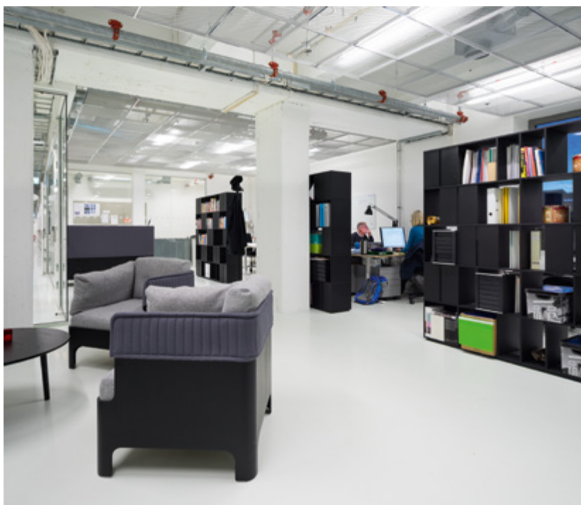
Pausekrok for administrasjonen.